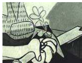
Picasso, Guernica (particolare)