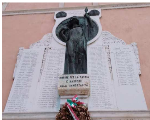
Monumento ai Caduti della prima e seconda guerra mondiale e alle vittime civili e della Resistenza. Pescantina (Piazza S. Rocco)

Viktor E. Frankl , Uno psicologo nei Lager